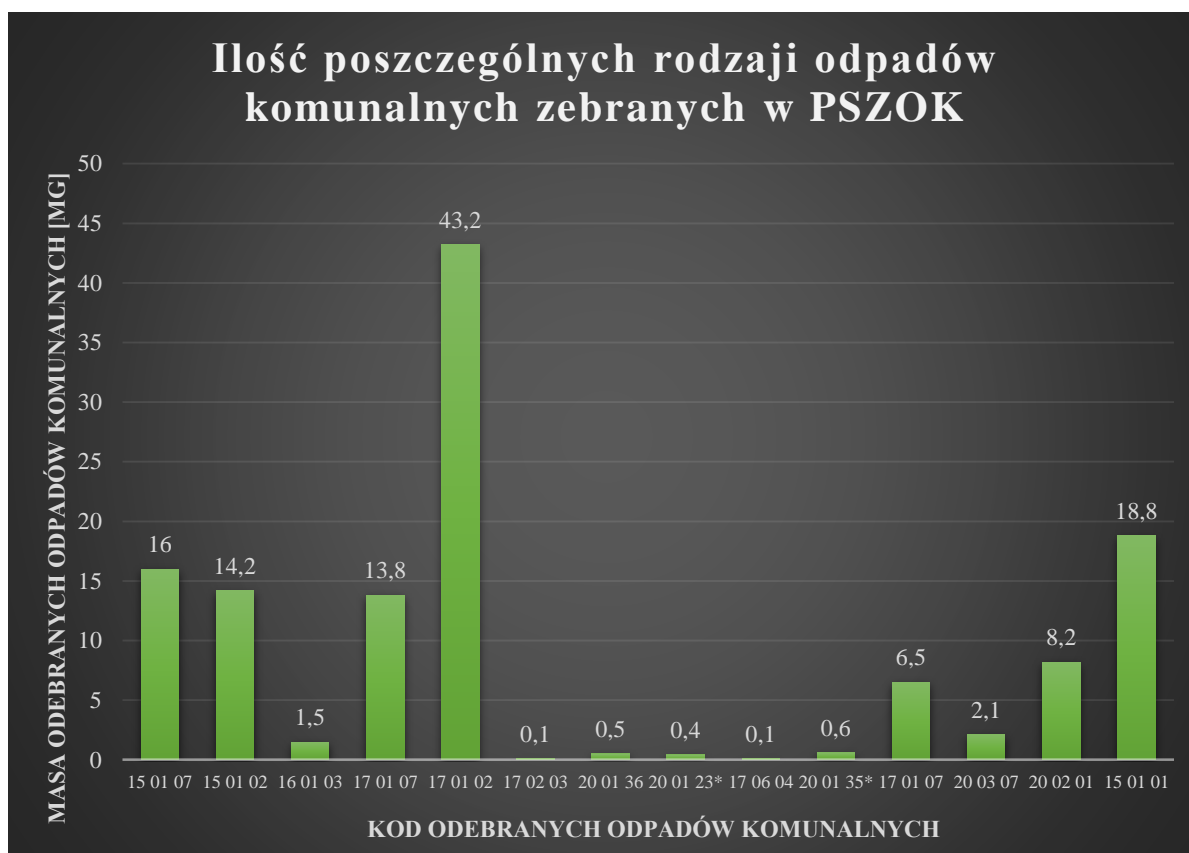
Wykres nr 2. Ilość poszczególnych rodzajów odpadów komunalnych zebranych w Punkcie Selektywnej Zbiórki Odpadów Komunalnych