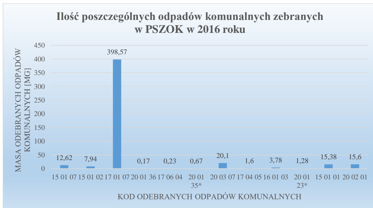
Wykres nr 2. Ilość poszczególnych rodzajów odpadów komunalnych zebranych w Punkcie Selektywnej Zbiórki Odpadów Komunalnych