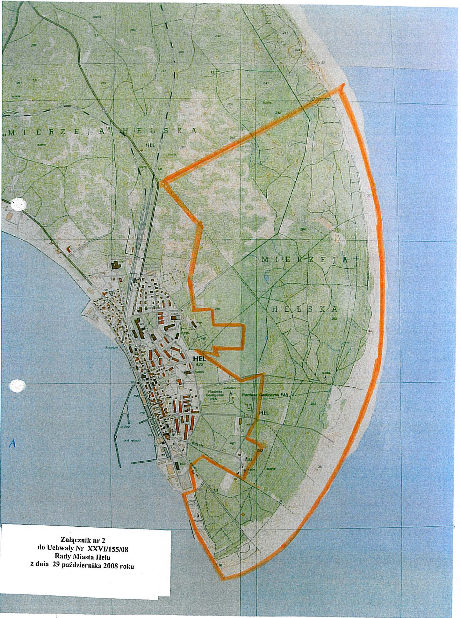
Załącznik nr 2 do Uchwały Nr XXVI/155/08 Rady Miasta Helu z dnia 29 października 2008 roku