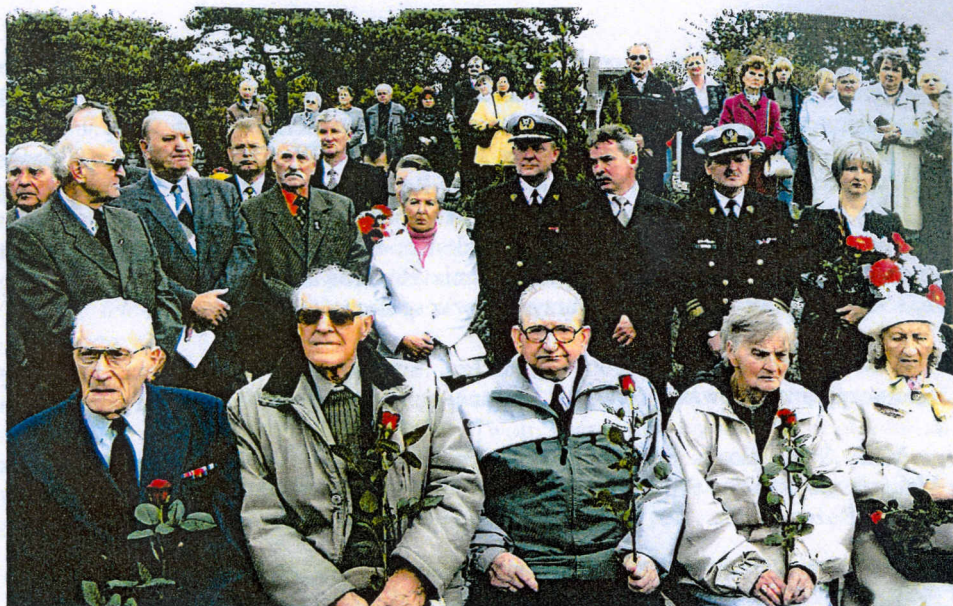
Weterani i zaproszeni goście