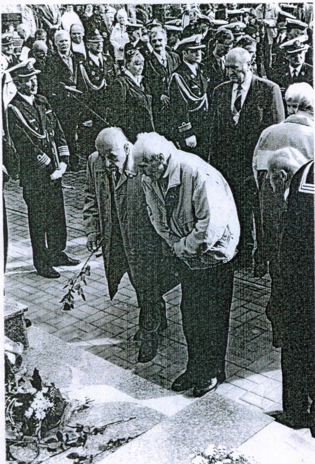
Składanie kwiatów na mogile Kolegów