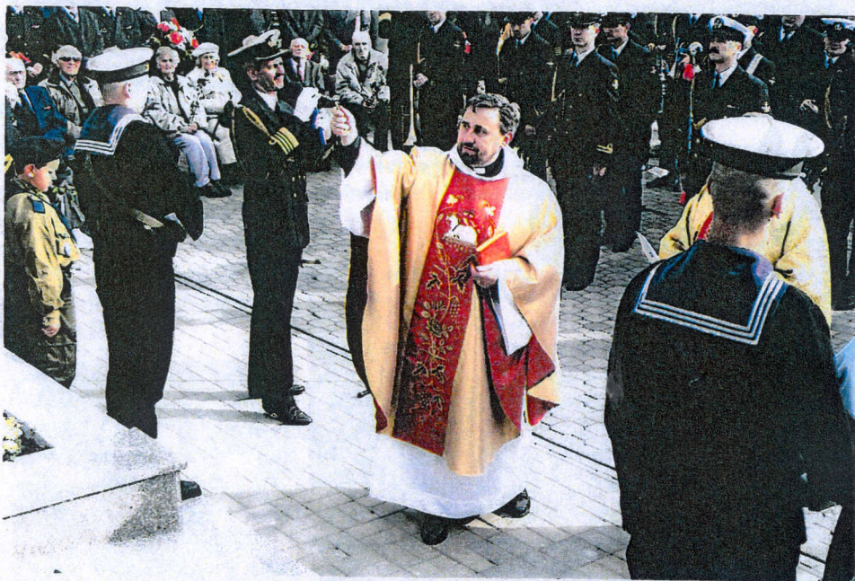
Poświęcenie odrestaurowanego Pomnika – Zbiorowej Mogiły