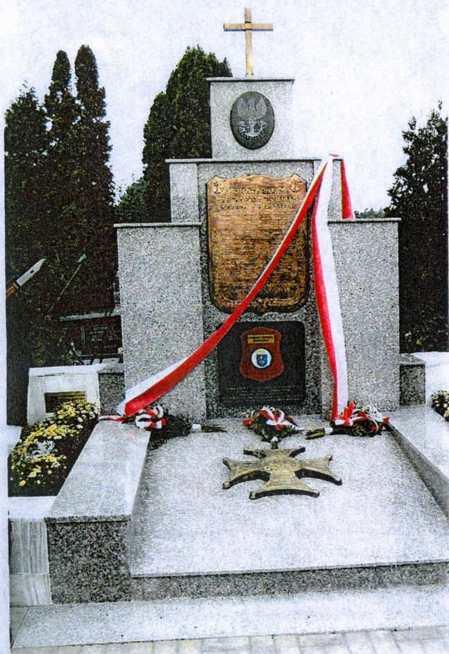
Odrestaurowany Pomnik - - Zbiorowa Mogiła 31. Bohaterskich Obrońców Helu w 1939 roku