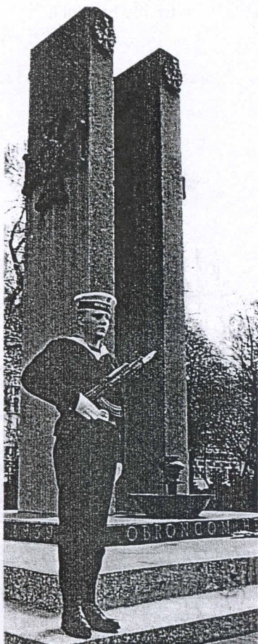
Dwa pylony – symboliczny pomnik Obrońców Helu

Następnie przeszli pod pomnik bohaterskich żołnierzy IV. Batalionu Korpusu Ochrony Pogranicza „HEL”, który w 1939 roku został przebazowany z m. Sienkiewicze na Polesiu do Helu. Złożone tam wiązanek kwiatów były wyrazem szacunku dla tych żołnierzy.