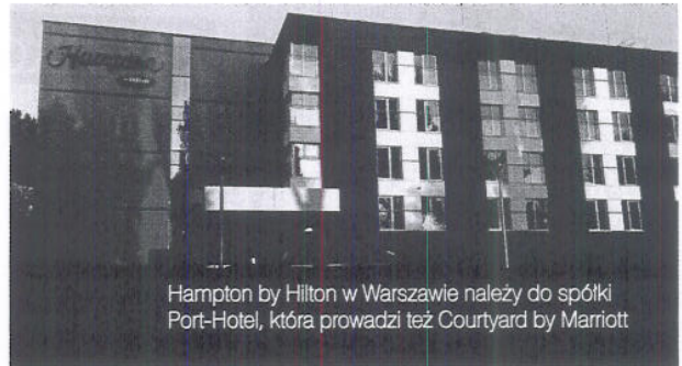
Hampton by Hilton w Warszawie należy do spółki Port-Hotel, która prowadzi też Courtyard by Marriott

Właścicielem i operatorem obiektu jest spółka Port-Hotel należąca do Przedsiębiorstwa Państwowego Porty Lotnicze. Spółka jest też właścicielem i zarządza uruchomionym 10 lat temu hotelem Courtyard by Marriott na Lotnisku Chopina. W 2011 roku Port-Hotel zawarł umowy dzierżawy i franczyzy na dwa projekty hotelowe: Hampton by Hilton w Warszawie i bliźniaczy Hampton by Hilton w Gdańsku (otwarcie planowane jest na jesień). Port-Hotel jest współinwestorem i będzie dzierżawcą 5-gwiazd-