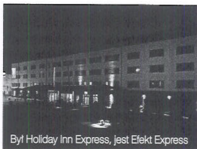
Był Holiday Inn Express, jest Efekt Express

Według deklaracji dyrekcji, zmiana nazwy hotelu nie będzie niosła jakichkolwiek zmian dotyczących standardu oraz komfortu wyposażenia. Hotel należy do spółki giełdowej Efekt, która prowadzi również 4-gwiazdkowy Best Western Premier w tej samej lokalizacji. Oba działają pod globalnymi markami od kilku lat. Dlaczego właściciele postanowili zakończyć współpracę z IHG? – Zdecydowały o tym duże koszty uczestnictwa w sieci, które nie przekładały się na obłożenie naszego hotelu, a te pozyskiwaliśmy głównie dzięki własnym działaniom marketingowym. Nosiliśmy się z tą