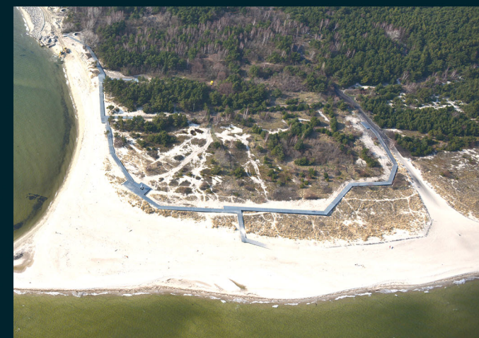
Rok 2013. Zniszczone wydmy oraz nowe pomosty służące skanalizowaniu ruchu osób odwiedzających Helski Cypel.

Główny, spodziewany ekologiczny efekt projektu to: odtworzenie i skuteczna ochrona naturalnego charakteru siedlisk wydmych wraz z ich swoistą strukturą roślinności przy zachowaniu naturalnych walorów krajobrazowych tego miejsca.