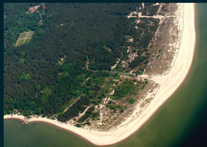
Rok 2007. Inwazja obcej roślinności oraz początki wydeptywania powierzchni wydmy Helskiego Cypla.

Działania naprawcze i ochronne są w tej sytuacji działaniem logicznym i koniecznym. Dlatego właśnie podjęto działanie polegające na rewitalizacji szaty roślinnej i wydmych siedlisk przyrodniczych Cypla Helskiego. Realizatorem jest Fundacja Rozwoju Uniwersytetu Gdańskiego oraz wyspecjalizowani w ochronie przyrody uniwersyteccy eksperci – botanicy i ekolodzy. Projekt wspierają zarządzający Cyplem: Urząd Morski w Gdyni oraz Nadleśnictwo Wejherowo.