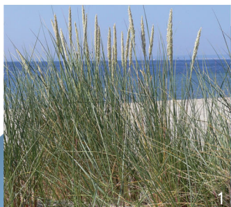
Fotografie roślin wydmych Jacek Herbich