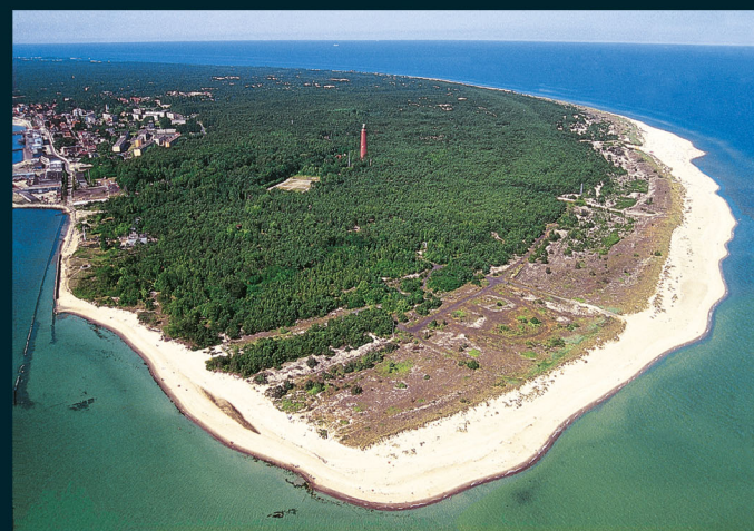
Rok 1994. Szare wydmy Helskiego Cypla wolne od gatunków obcych i presji turystycznej

Naturalne zróżnicowanie przyrody w miarę stopniowego wydłużania nadwodnej części półwyspowego cypla to wynik stopniowego rozwoju gleb. Proces ma oparcie w stale dobudowywanej plaży. Piasku dostarcza jej morze i zatoka. Pionierska plażowa roślinność powstrzymuje jego zbyt swobodne przemieszczanie. Budują się wydmy przednie (pierwotne), które w miarę zagęszczania roślin i gromadzenia piasku tworzą pozabawione jeszcze próchnicy wydmy białe (stąd ich nazwa). W tym trudnym, niestabilnym siedlisku królują przystosowane do życia w ruchomych piaskach gatunki wysokich traw wydmych.